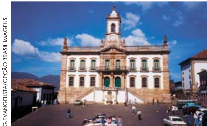
Museu da Inconfidência em Ouro Preto (MG).